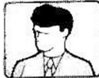
plano medio corto