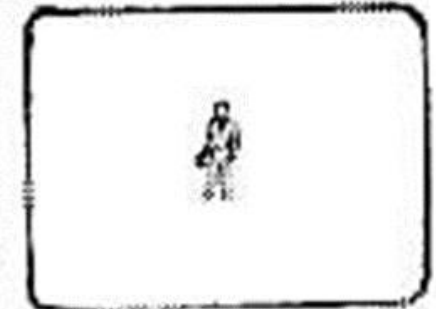
gran plano general