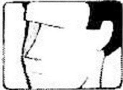
primerisimo primer plano