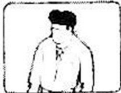
plano medio largo